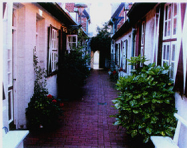
Der Hövelgang mit Blickrichtung zur Straßenseite. Hinter kleinen und engen Eingängen verbergen sich in Lübecks Altstadt Wohnwelten, die der unkundige Besucher kaum vermutet

hat. „Schnuckelig! Und so schön ruhig hier! Ein richtiger Schatz!“, ruft sie entzückt. Das Ehepaar aus Siegen bewundert die Reihe kleiner aneinander gekuschelter Häuser mit ihren engen Türen und fast nur lukengroßen Fenstern. Die meisten von ihnen sind mit prächtig blühenden Blumen in Kästen und