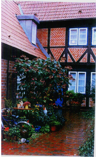
Die Innenhöfe sind Spielplätze für Kinder und Freizeiträume für Erwachsene vor dem Haus im Herzen der Hansestadt und ohne Verkehrsgefährdung

mussten mindestens so breit sein, dass ein Sarg hindurch passte. Magdanz malt das Bild damaligen Lebens: „Wo heute in der Altstadt 10000 Menschen wohnen, lebten im Mittelalter 25000 Lübecker. In einem Raum hausten Familien mit zehn oder mehr Mitgliedern.“ Im 17. Jahrhundert soll es 180 Gänge und Höfe gegeben haben. Heute sind es knapp